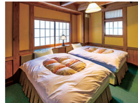
寝室 健やかな眠りへ誘うベッドルーム。