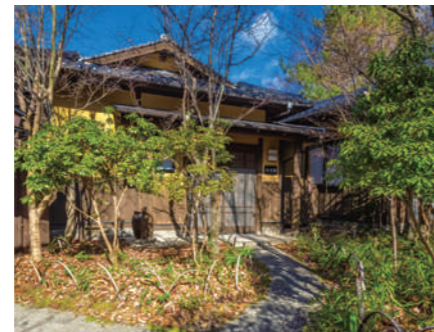
外観 あたたかなやすらぎへと続く離れの小路。