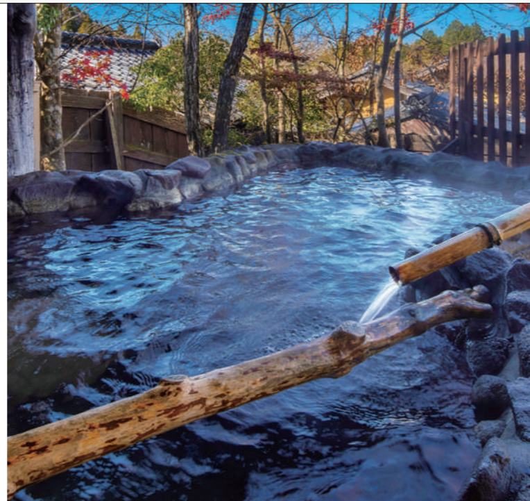
露天風呂 離れの露天風呂の中で最も大きな岩風呂。手前は深さ1m10cmの立ち湯、奥は腰掛けて入れる深さで、目の前に広がる美しい自然も一人占め。