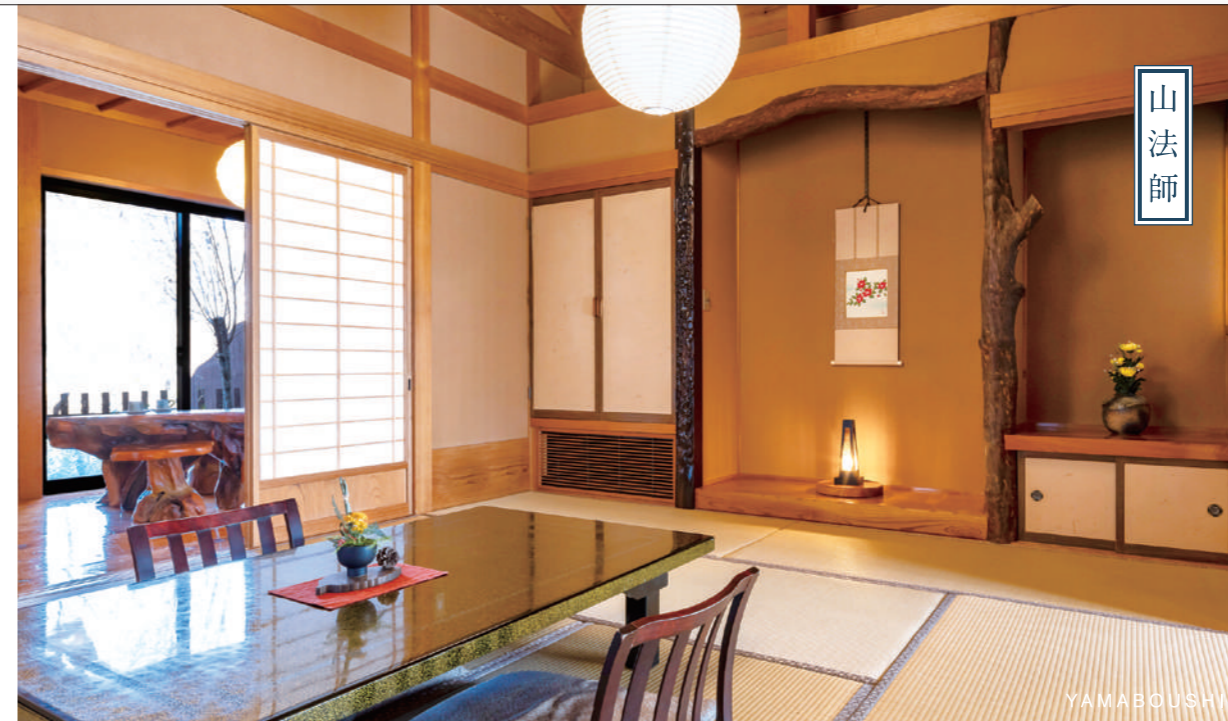
和室 開放感あふれる高い天井と、大きな梁が特徴の10畳の和室。木のぬくもりを感じられる広々とした部屋には、ゆったりとした優しい時間が流れている。

心がほどけるやすらぎの空間 風情ある小路を辿り離れの客室へ。 扉を開けるとそこには やすらぎの空間が広がっている。 それぞれ趣の異なる空間が 日々の喧騒を忘れさせてくれる。