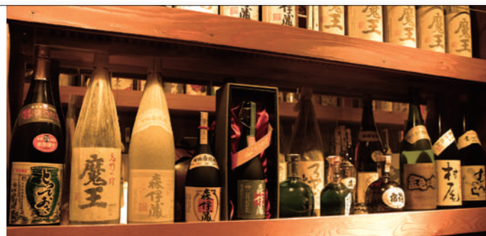
300種類の焼酎セラー 長い年月をかけて集めた焼酎コレクション。