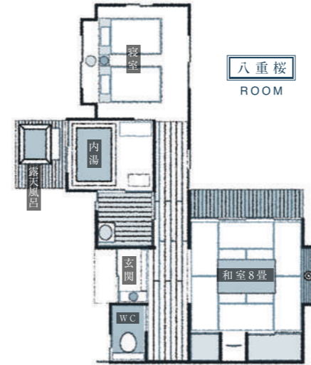
YAEZAKURA 和室8畳 ベッドルーム 内湯 露天風呂 最大4名様までご利用可能