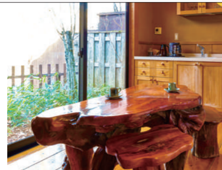
喫茶室 くつろぎが約束された空間。