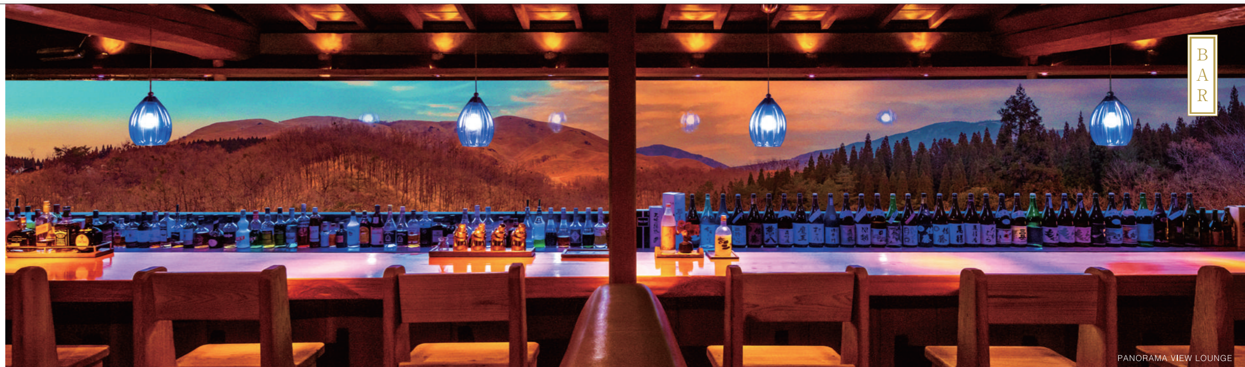
圧巻のパノラマカウンター

新緑の青、紅葉の赤、新雪の白…季節によって表情を変える山あいの風景。爽やかな昼間の景色もさることながら、ライトアップされた夜のバーカウンターで過ごすひとは、宿泊者だけが開けられる特別な宝箱のよう。