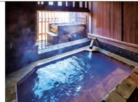
内湯・露天風呂 2つの温泉が楽しめる。