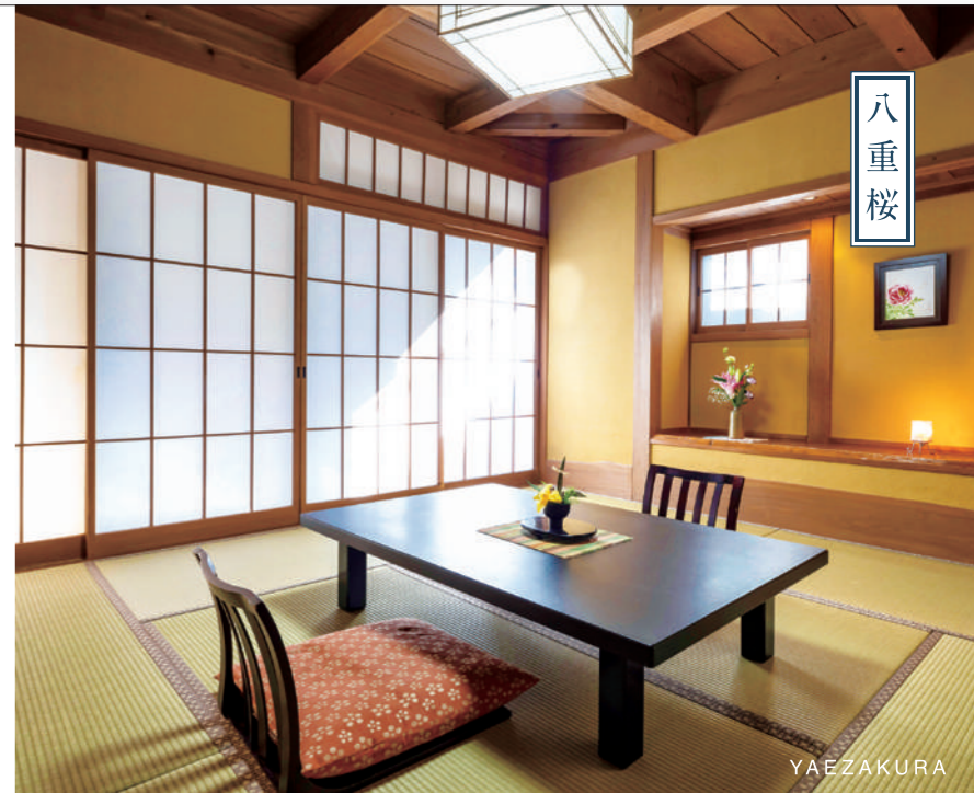
和室 中庭を望む8畳の和室。湯上がりに、縁側でのんびり涼めるのはこの部屋だけ。温泉の湯気と共に、懐かしく愛しい記憶がふと立ち上る。いつかの思い出までたたためる一室。

樹やしき 本館のご案内 離れの他にも「樹やしき本館」もございます。お気軽にお問い合わせください。