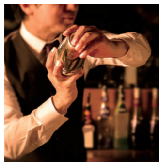
本格的なカクテル 気分に合わせていろいろなお酒が楽しめる。